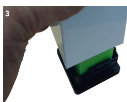
3) Encajar nuevamente base ya cargada!