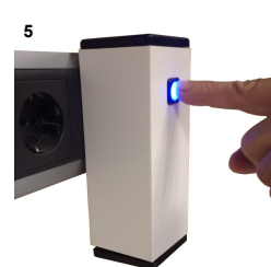
5) Al presionarlo, el botón se ilumina y se pone en marcha. Alejarla de corrientes o extractores. No introducir objetos o mojar.