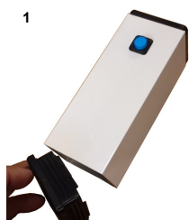
1) Desensamblar base (a presión)